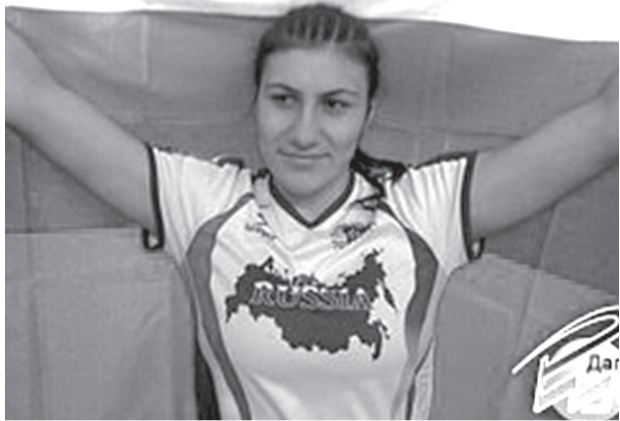
Зухраб Манаповасул раглабазда рекьон, Стамбулалда тлобитлараб турнир Земфирае буклана кватичлого буклине кколеб дунялалгьул

чемпионаталде хладурлгьилгьун. Гьеб тлобитлизе буго 13-26 ноябралда Кореялда. Земфира ккола жиндирго цайиялда Россиялгьул тласабишараб команда ялгьул лидер ва дунялалгьул чемпионаталда гьел глахьаллги гьабиялда щаклги гьечло.